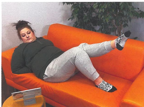
Skoliose-Versorgung zu Hause mit fachlicher Anleitung.

Die EvoCare®-Methode, so das Unternehmen, sei genauso wirksam wie klassische Therapie und hat auch per Studien den Ökonomie-Check bestanden.