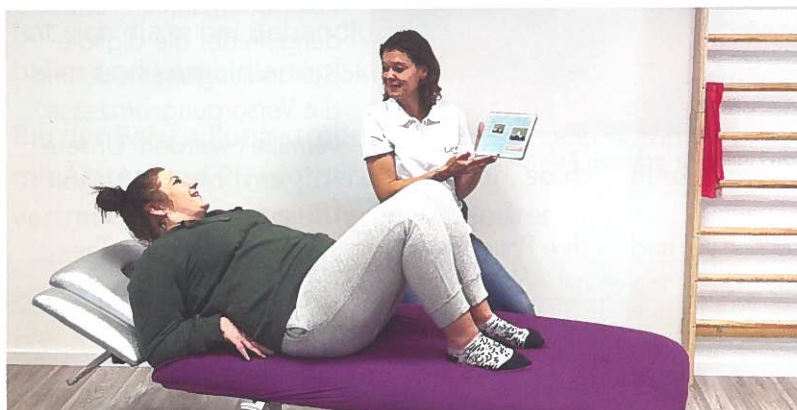
Einführung in die digitale Behandlung.

Gerade in angespannten Zeiten, in denen Personal und Zeit wertvolle Ressourcen sind, leisten telemedizinische Behandlungsmethoden wie EvoCare® einen wertvollen Beitrag für eine pandemiesichere und wirksame Behandlung ohne zusätzliche Belastung.